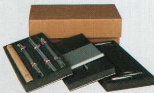
Drei Panels (hier noch ohne Text und Grafik)

der Ogis Botschaft mittragen will, kann seinen Kanzlisten anweisen, das Paket zu bestellen. Die zwei sind dann ohne Probleme im Stande, die Ausstellung eigenhändig aufzubauen; die Gebrauchsanweisung in acht Punkten wird mitgeschickt.