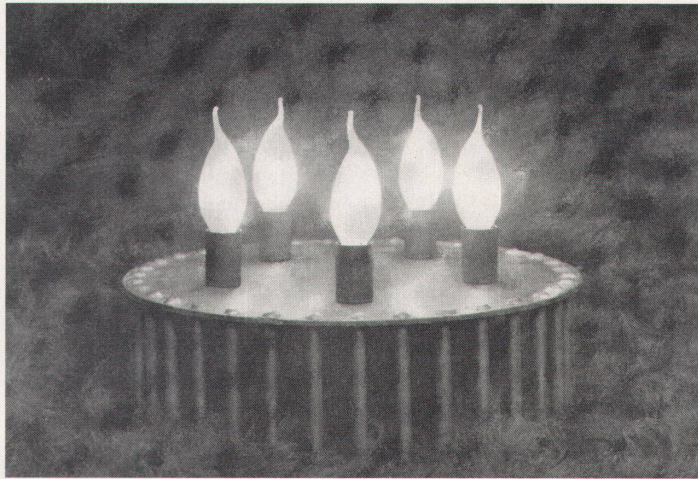
Eine Geburtstagstorte ganz im Stil der Neuen Werkstatt

Kürzlich war Geburtstag: Die Neue Werkstatt, eine Gruppe von drei Gestaltern, feierte ihr fünfjähriges Jubiläum. Es gibt ein interessantes und vielfältiges werdendes Werk zu besichtigen, das sich vom kleinen Schmuckstück bis zu grösseren Arbeiten in Raum, Möbel und Licht erstreckt. Eine Reportage von Adalbert Locher über Handwerk, Material, Form und Angemessenheit.