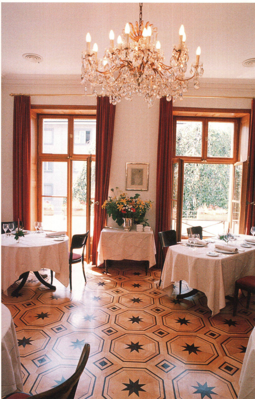
Blick in «Das Restaurant» im 1. Stockwerk (links)

Die Inneneinrichtung hat Kunstanspruch: ein Gästezimmer, gestaltet von Hubertus Gojowczyk, Krefeld (D) (rechts)