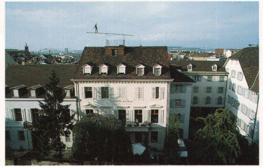
Der «Teufelhof», Träger des Design Preis Schweiz Unternehmen 1993, liegt am Rand von Basels Altstadt