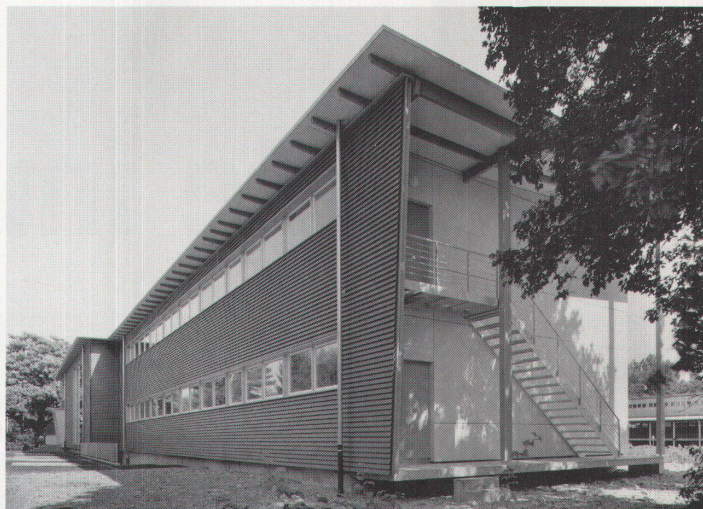
Rudolf Brüderlin erweiterte das Hebelschulhaus mit einem Holzbau