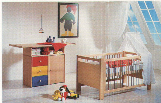
Die Grundausstattung des Kinderzimmers legt den Grundstein für die Möbel für später (oben)

Um nicht alle fünf Jahre das Kinderzimmer neu einrichten zu müssen, ist es von Vorteil, wenn die Einrichtungsgegenstände über die Jahre hinaus mitwachsen und sich der rasch verändernden Körpergrösse anpassen lassen. Sinnvoll ist eine solche Verwandlung jedoch nur dann, wenn die daraus entstehenden Möbel auch ergonomisch der Körpergrösse des Kindes angepasst sind. Ein solches Beispiel ist der Stuhl «Tripp Trapp» vom