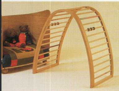
«A lua» von Markus Harm besteht aus drei Möbeln in einem: Das Gitter des eiförmigen Bettes kann als Spielgitter gebraucht werden, das Kopfteil wird später zum Sessel

Laufgitter mit verschiedenen Sprossen aus Leder, Silikon und mit Holzkugeln. «A lua», das sind drei Möbel in einem: Will das Kind mit drei Jahren nicht mehr hinter Gitter schlafen, so wird das Gitter des Bettes zum Spielgerüst. Ist das Kind fürs Bettchen zu gross, wird aus dem Kopfteil ein Sessel.