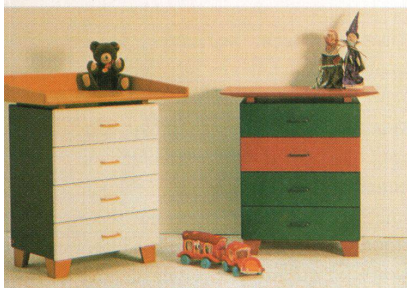
Die Wickelkommode «Alpha» von Rothen lässt sich der Körpergrösse anpassen (links) Die frei wählbaren, bunten und weissen «Colibri»-Bauelemente ermöglichen verschiedene Kombinationen