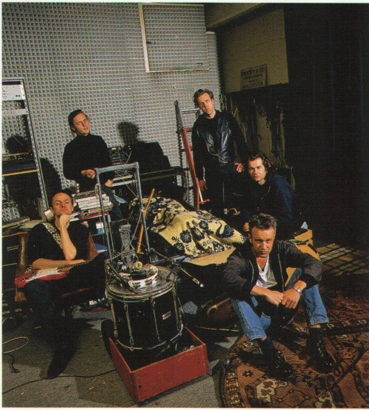
Züri West sind v.l.n.r. Peter von Siebenthal, Martin Gerber, Markus Fehlmann, Gert Stäuble und Kuno Lauener