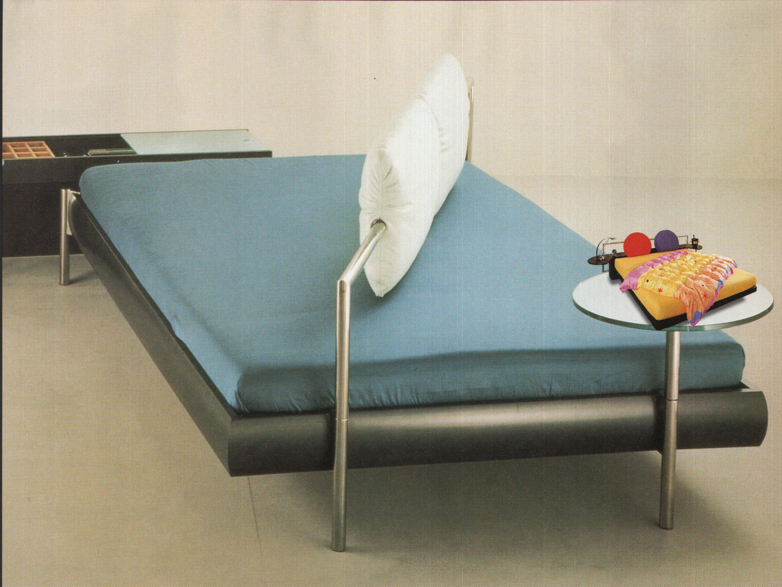
«Singoletto» – die flexiblen Lederpolster am Kopfende verwandeln das Bett in ein Sofa