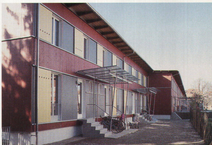
Siedlung Niederholzboden der Metron. Der Raumluft wird die Abwärme entzogen