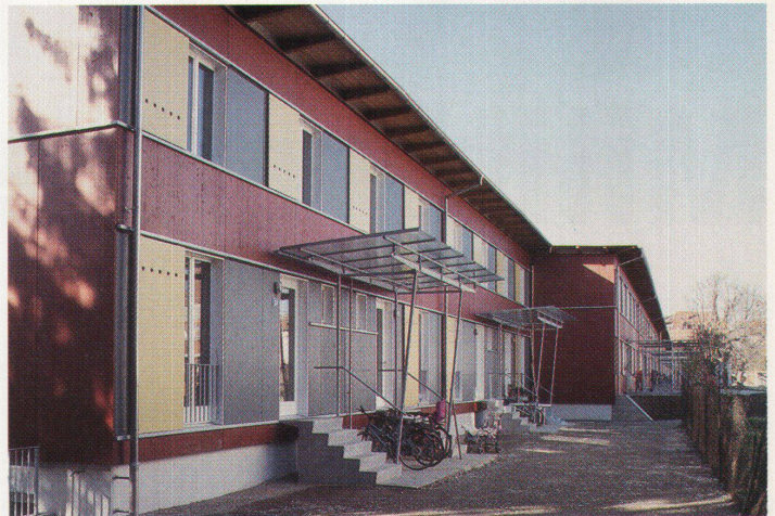
Siedlung Niederholzboden der Metron. Der Raumluft wird die Abwärme entzogen