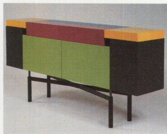
Farbenfroh: Die Kommode C2 aus der ersten Kollektion von Kreis 4