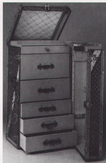
Ein Schrankkoffer von Louis Vuitton von 1917

Die traditionellen SIA-Tage finden dieses Jahr unter dem Motto «Basel, eine Region, drei Länder» statt. Referate von Regierungsrat Christoph Stutz und Claude Nicollier, vier Exkursionen mit verschiedenen Stationen in Deutschland, Frankreich und der Schweiz zu den Themen Kunst, Architektur, Design, Basel-Freiburg-Colmar, Archäogeometrie und «Der Rhein, Lebensader der Region» sollen die Region Basel vorstellen und die Ingenieure und Architekten weiterbilden. Info: Planconsult, Byfangweg 1a, 4006 Basel, Termin: 25. bis 27. August.