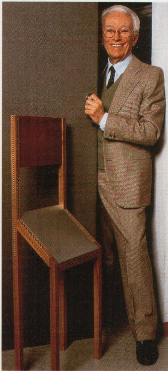
Bruno Munari, der italienische Designer ist bekannt für seine Bücher und Bilder