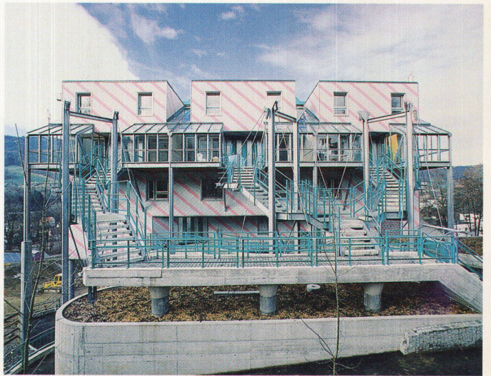
Ein Stück Terrassensiedlung von der Rückseite aus gesehen