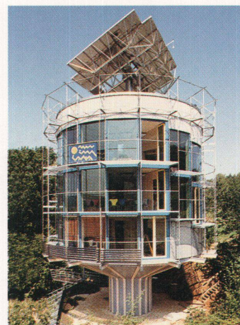
Das Heliotrop von Rolf Disch in Freiburg

Während der Swissbau 95 werden Besichtigungen von aktuellen Bauwerken und Fachtagungen verschiedener Art organisiert. Architekten und Ingenieure können gratis an halbtägigen Architektur-Führungen teilnehmen. Die Führungen wurden vom Architekturmuseum Basel zusammengestellt und werden von Mitarbeitern der ausführenden Architekturbüros geleitet. Das Programm wechselt täglich. Interessierte können Programm und Anmeldeunterlagen bestellen bei: Swissbau 95, Kommunikation, Postfach, 4021 Basel, Fax 061 / 686 21 91. Termin: 7. bis 11. Februar. Auch die Fachtagung Prima Materia der IG Lehmabau findet an zwei Tagen der Swissbau statt. Die Referenten und Workshopleiter sind Lisbeth Sachs, Thomas Kleespies, Gernot Minke, Hans Ruh, Arwed Meier-Junginger, Markus Billerbeck, Barbara