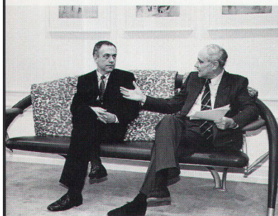
Flavio Cotti und Andrej Kosyrew zusammen auf Andrea Branzis Sofa

Aufs eindringlichste redet unser Bundesrat Flavio Cotti mit dem russischen Aussenminister Andrej Kosyrew, der schon etwas gelangweilt in die Ferne blickt. Liegt das Unbehagen wohl am Kanapee? Es handelt sich um einen Entwurf von Andrea Branzi und