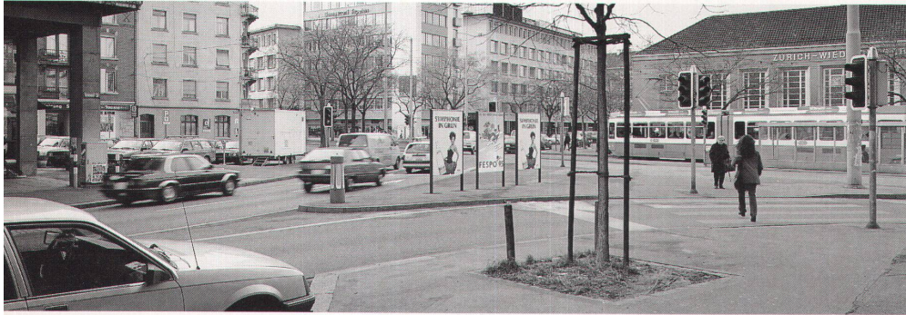
Meili: «Seien es die Kommerzialisierung von Fassaden, offene Kunstaktionen, das Sprayen, ein schlecht geordnetes Nachtleben, was auch immer. Im Grunde hat die Stadt nie über ein Erdulden dieser Erscheinungen hinausgefunden.»

nungsdanken nur noch wegen seiner Standhaftigkeit bewundern oder ob seiner Hilflosigkeit belächeln.