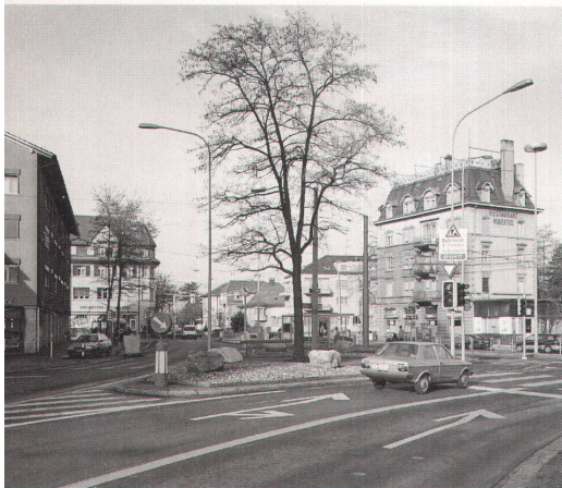
Heller: «Zu nennen wäre schliesslich der Wunsch nach Verschönerung, der den öffentlichen Raum mit Geranienorgien (Absender die Stadt) oder Löwenpopulationen (Absender die City-Vereinigung) karessiert.»