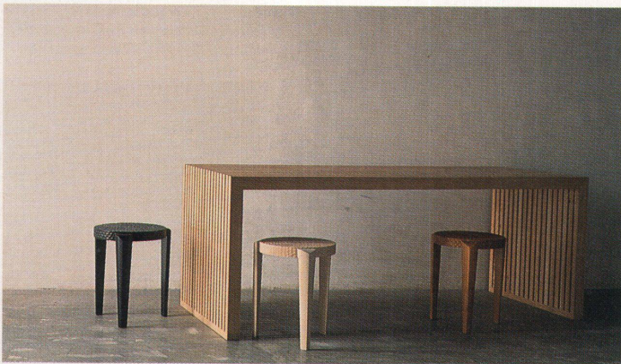
«Bank VI» aus Lärchenholz, hier als Tisch verwendet mit drei verschiedenen Ausführungen des Hockers «Pixie»

Im weissgetünchten Atelier an der Freyastrasse in Zürich, das zugleich auch Showroom ist, stehen die 240 cm langen, weisslackierten MDF-Bänke «Die weisse Bank», die Lärchenholzliege «Bench» (190 cm lang), die Sessel «L'impératrice» und «L Y X-Chair» aus Lärchenholz, «Bank I», «Bank III», «Bank IV», «Bank V», «Bank VI», «Bank VII» alles aus Lärchenholz, der stapelbare Hocker «Pixie» in Erle weiss, Kirsche geölt, Buche schwarz, der Prototyp des neuen «L Y X-Garden». Christine Sträuli hat eine Vorliebe für Holz, denn Holz riecht gut, fühlt sich gut an und lässt