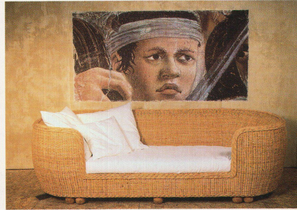
Das Sofa «Entertainer» der Firma Gunther Lambert ist aus Heavy Cane gemacht

Es muss nicht immer Rohr sein, auch geflochtenes Leder sieht schön aus, «Compania delle Filippine» von Antonio Citterio