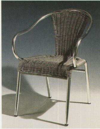
«Barcino» von Freemobil besteht aus wetterfestem, synthetischem Rattan

neue Faser, dazu hygienisch und hitzebeständig, hiess es damals. Das Wort Papier verschwieg Lloyd lieber und sprach stattdessen von «Fibre». Doch «Fibre» ist nichts anderes als gezwirntes Papier, das nicht nur flexibel ist, sondern auch zu fast endlosen Strängen gedreht und dann verwebt werden kann. Und wenn es mit Draht verstärkt wird, ist es belastbar. Lloyds Kinderwagen wurden zum Renner, und noch im gleichen Jahr verkaufte er Lizenzen für Lloyd Loom Möbel in die ganze Welt. Der Sessel «Malaga» der Firma Novantino in Erlenbach besteht aus einem massiven Buchenholz-Gestell, das mit drahtverstärkter, verzwirnter Cellulosefaser verflochten ist.