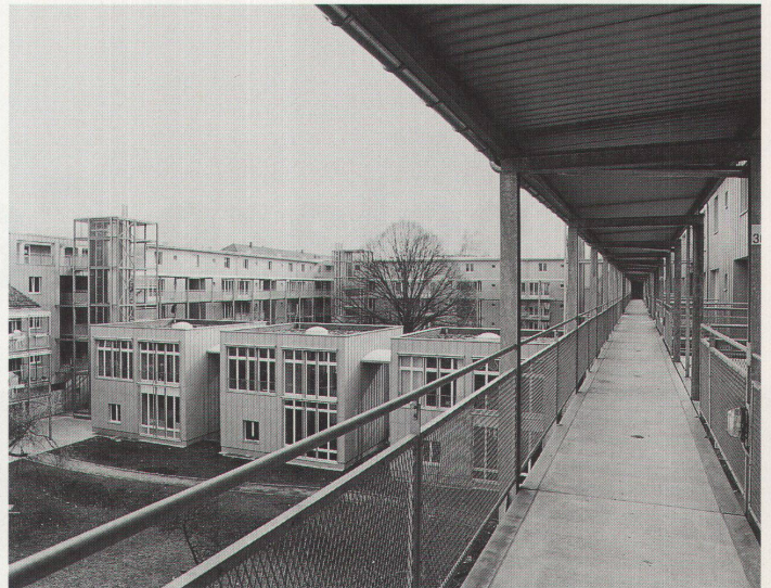
Die Wohnüberbauung Brahmshof in Zürich von Kuhn Fischer Partner