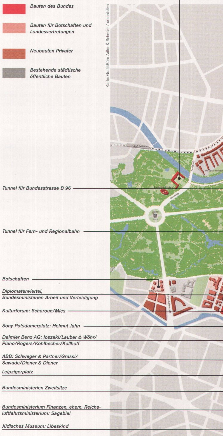
Karte: GrafikBüro Adler & Schmidt / urbanistica