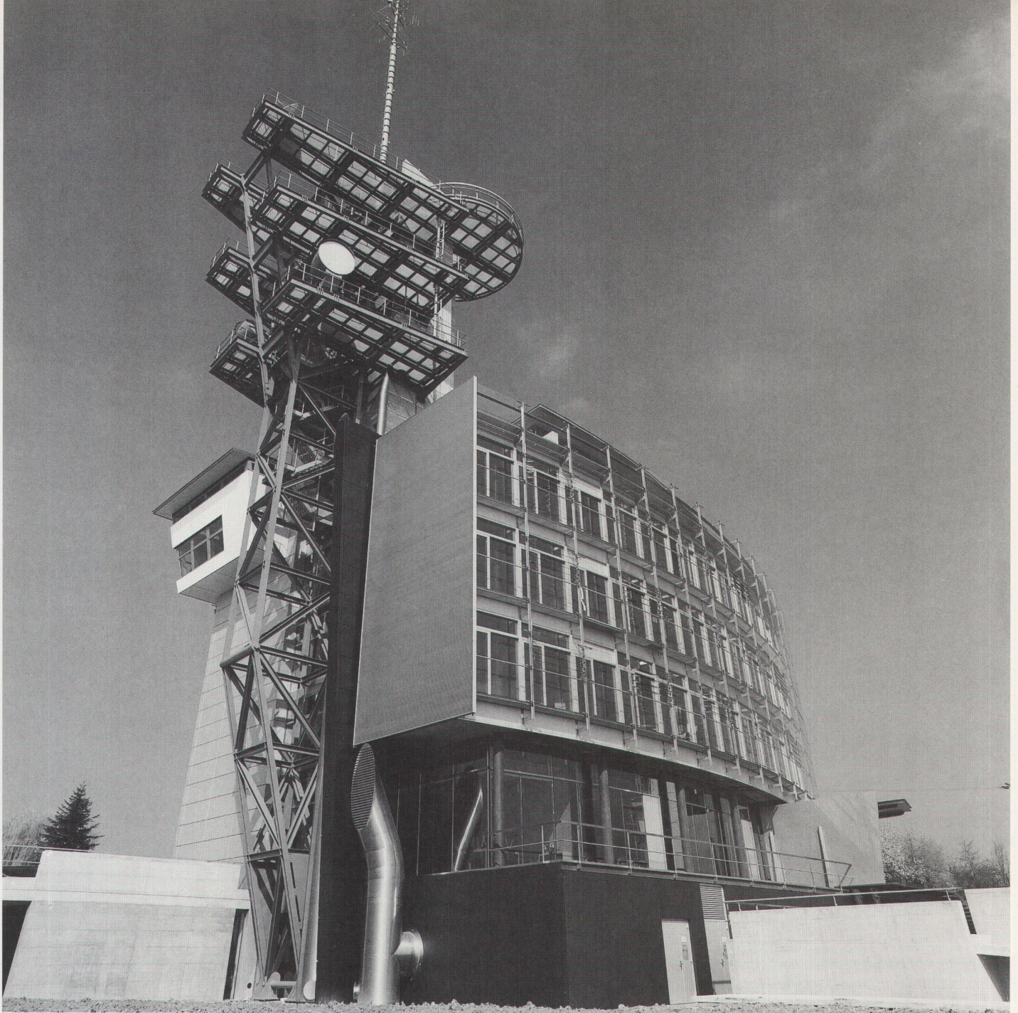
Luschers Turm ist ein Konglomerat mit unterschiedlich materialisierten Fassaden

Bodens tief durchatmend gewagt. Auf der frei auskragenden Konstruktion an der Nord-West-Ecke habe ich mich angesichts der spärlich gesetzten, dünnen Geländerstäbe an die Wand gedrückt.