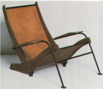
Sessel von Jean Prouvé

Zum zehnten Geburtstag schenkt sich die Fondation Louis Moret in Martigny eine Ausstellung mit den Werken des französischen Architekten und Designers Jean Prouvé. Gezeigt werden eine Auswahl seiner Möbel zwischen 1929 und 1953, verschiedene Pläne und Skizzen sowie zwei Filme – einer davon aus dem Jahr 1954 – und eine Diashow. Termin: bis 20. August, Fondation Louis Moret, Chemin des Barrières 31, 1920 Martigny, 026 / 22 23 47.