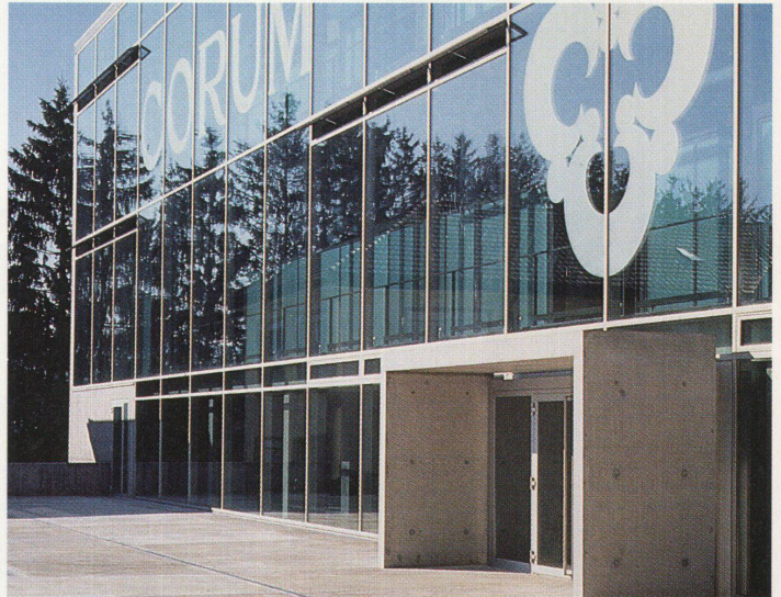
Das neue Corum Gebäude in La Chaux-de-Fonds von Althammer und Hochuli