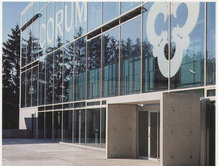
Das neue Corum Gebäude in La Chaux-de-Fonds von Althammer und Hochuli