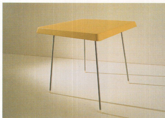
Ross Lovegrove hat den Tisch «Tavolo eight» für Cappelini entworfen. Er ist aus Aluminium, Nylon und Polyurethan gemacht

Früher benutzte man Kunststoff für Gartenstühle und Kühlbehälter, weil er praktisch und hygienisch war. In den sechziger und siebziger Jahren entstanden dann weitere Möbel, doch