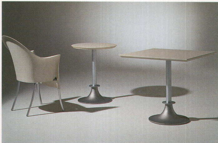
Auch Philippe Starck setzt auf Polypropylen mit seinem Stuhl «Lord Yo» und neu dazu das Tischchen «Lord Yi» für Aleph

Ein überaus schnittiges Möbel ist «Homer». Diesen Stuhl haben die bei-