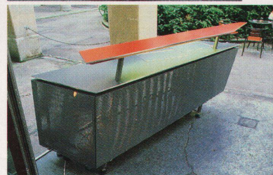
Aufklappen und sofort betriebsbereit: die Klappbar

Restaurant Rosaly's eine mobile Bar-kombination für Festzelte und Bankette. Der Transportwagen ist auch grad die Tragkonstruktion. Einfach zusammenzubauen und einfach zu mieten bei: 01 / 261 44 30.