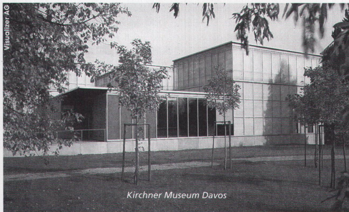
Kirchner Museum Davos