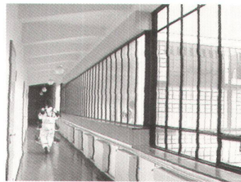
In der Videoarbeit «Bildgang» sind beim Aufnahmeverfahren zwölf Kameras am Körper montiert