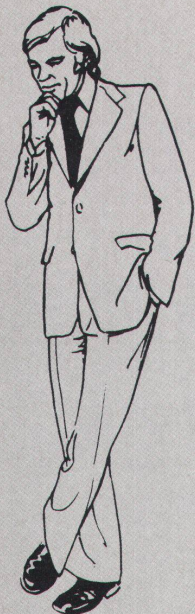
Cornel Windlin bei der Lösung eines komplexen gestalterischen Problems