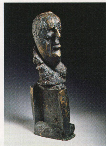
Portrait Mies van der Rohe in Bronze