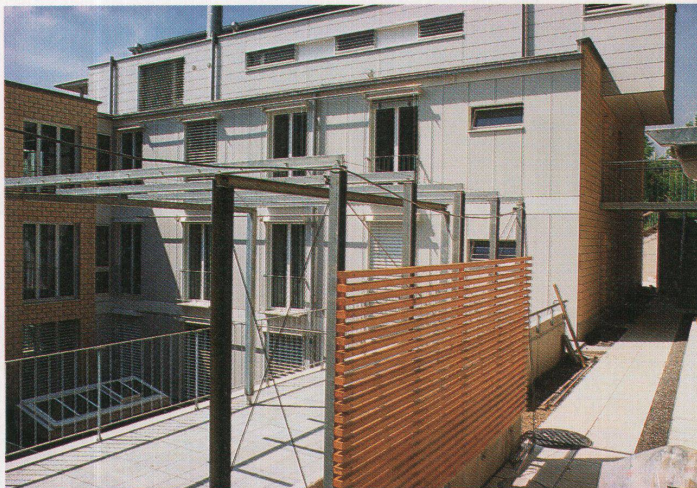
Hofseite der Wohnüberbauung «Im Sydefädel» in Zürich von ADP