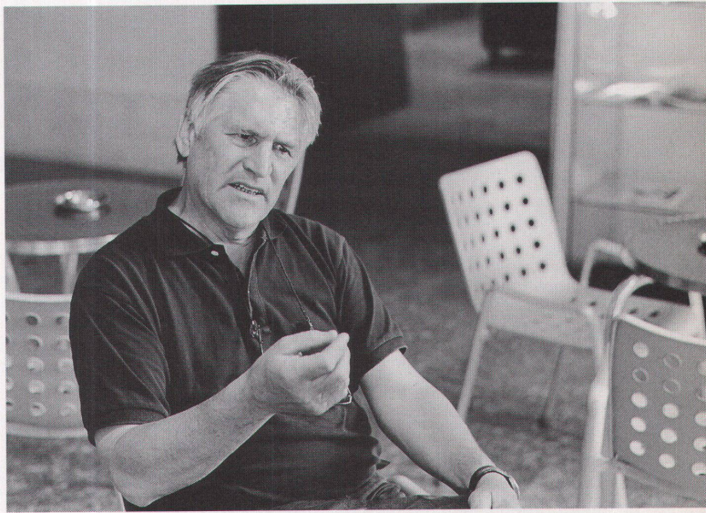
... Weiterbildung für Fachleute wie auch für Laien

im Pool der Administration. Wir haben nur zweieinhalb Stellen im Design Center, deshalb ist es angenehm, wenn nun das Sekretariat der Stiftung hierher kommt: Das gibt uns eine gewisse Entlastung.