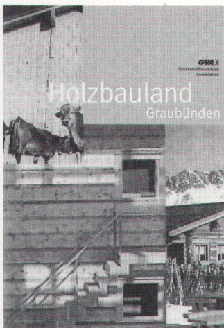
Holzbauland – eine neue Publikation von Hochparterre zu Graubünden

stoff. Sie schränkt seine Verwendung ein und galt darum unter Architekten und Bauherren als Verhinderin der Holzbauweise.