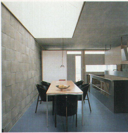
Bilder: Dominique Uléry