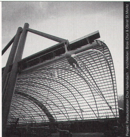
Projekt: Poststation Chur Hallertal Architekt: Brossi, Chur & Obert, St. Moritz

Stahl-Glas-Konstruktionen in architektonisch perfekter Vollendung verwirklichen wir mit innovativen Ideen und höchsten Anforderungen an Materialien und Ausführung.