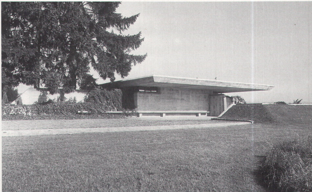
Die Abdankungshalle von Ernst Studer, wie sie nach ihrer Vollendung im Jahr 1962 ausgesehen hat