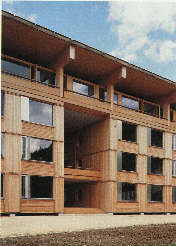
Die Schweizer Hochschule für Holzwirtschaft in Biel von Meili/Peter

Hochparterre 10/99 erscheint am 6. Oktober.