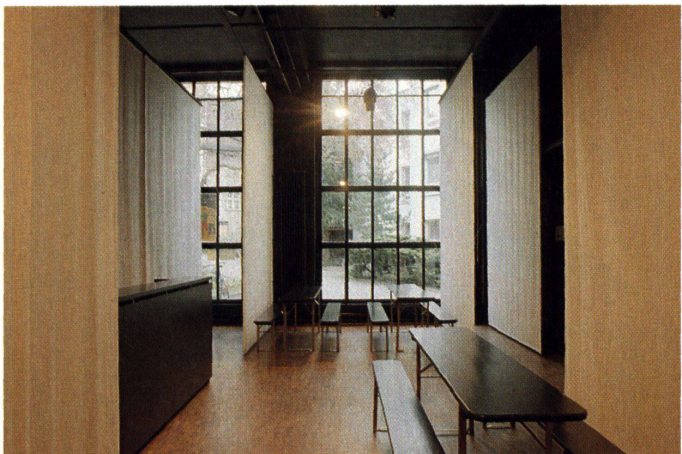
Mit an Soffitten erinnernde Stoffbahnen lässt sich der Theaterraum unterteilen