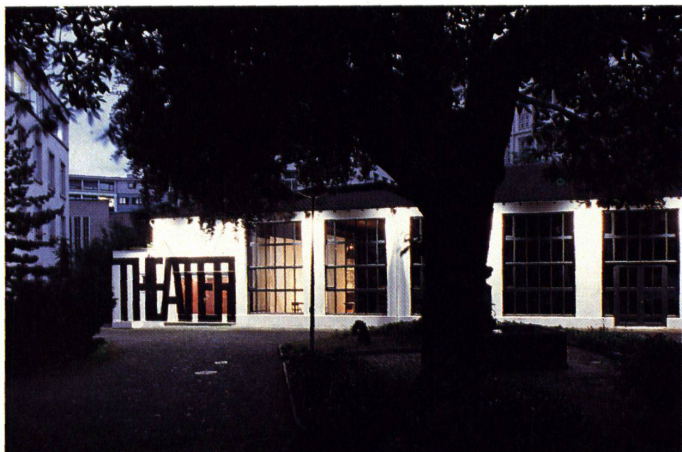
Der idyllische Hof mit grossem Baum