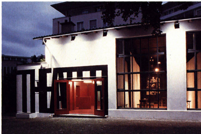
Das Rot des Eingangs lockt die Besucher an

nenvorhang. Er leitet von der realen Welt ins Spiel über.