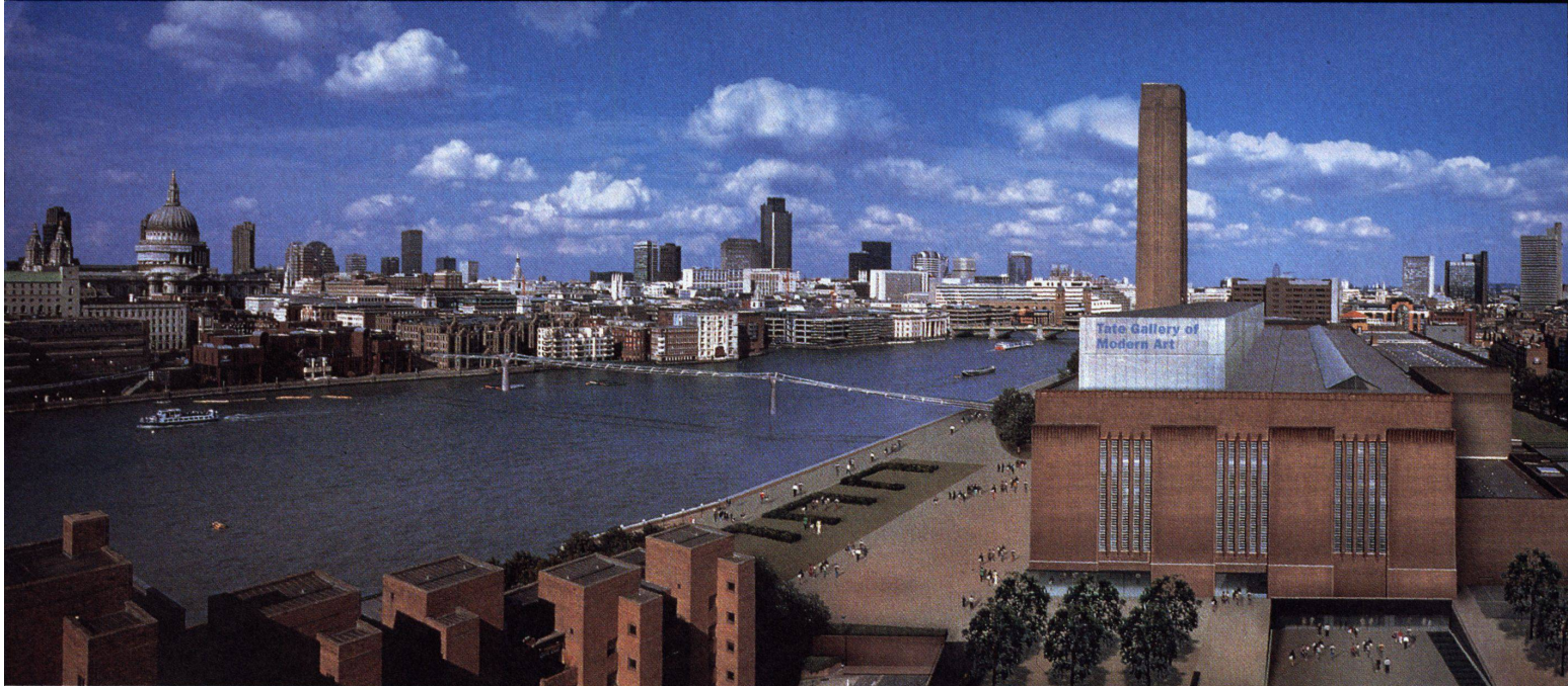
Nun hat die Skyline von London ein gewichtiges Gegenüber: die zur Tate Gallery umgebaute Power Station an der Themse