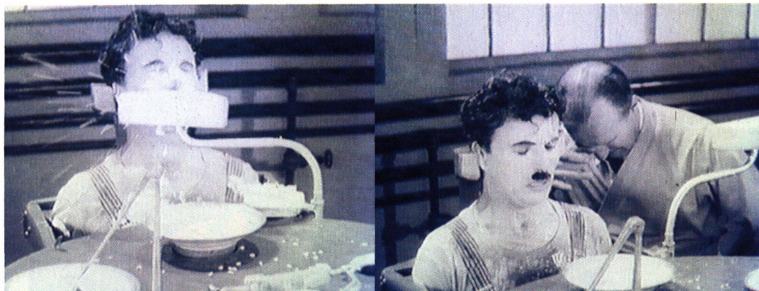
Videostills aus Modern Times von Charlie Chaplin, 1936; Betty Fleck

Raum. Videokameras und Mikrofone zeichnen alle seine Schritte im halbstündigen Test auf. Über eine Sprechverbindung können die Beobachter eingreifen. Heikle Situationen sind bereits umschifft, die Bedienung des Cursors, doppelt und dreifach belegte Funktionstasten und die langwierige Registrierung ist geschafft, die rätselhaften Icons sind identifiziert. Auch das Handbuch hat Herr A. kurz und erfolgreich konsultiert. Am Schluss bleibt dennoch der unbestimmte Verdacht, dass sich Aufwand und Ertrag für die Testperson nur bedingt entsprechen. Zu Hause wäre das Gerät wohl mit Schwung in einer Ecke gelandet. Trotz allem guten Zuredens bleibt bei Testpersonen das Gefühl, dass sie sich blöd anstellen. Vor einer Kamera. Kompetenz im Umgang mit immer komplizierteren Benutzeroberflächen wird gemeinhin vorausgesetzt; eine Erfahrung, die im Labor nicht einfach vergessen wird. Was die Laborsituation vom Alltag aber unterscheidet – es ist unmöglich, sich an Ort und Stelle zu-