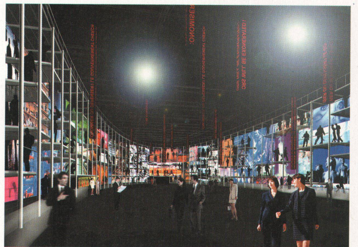
Ein umgekehrtes Globe Theater: der Entwurf für das Thema «Zukunft der Arbeit» von Jean Nouvel