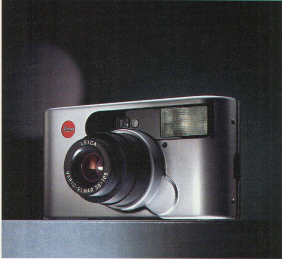
Die neue Leica C1 Kompaktkamera mit Aluminiumgehäuse, gestaltet von Klaus-Achim Heine

Hochparterre 6-7/2000 erscheint am 14. Juni 2000.