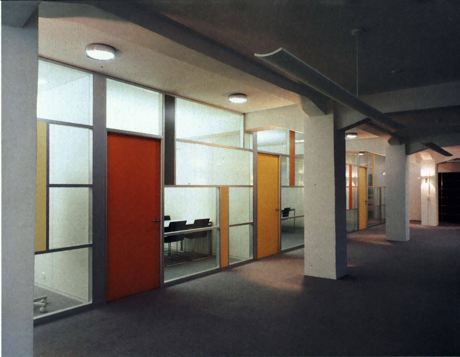
Links oben: Die unteren Gläser tragen die oberen, die Leisten fixieren lediglich die Position der Gläser. Das ermöglicht die freie geometrische Gestaltung der Glaswand