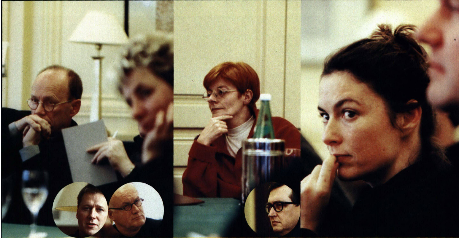
Bilder: Michael Freund

«Ein Stuhl ist ein Stuhl, ist ein Stuhl. Da sind doch alle Fragen geklärt. Die grossen Fragen sind die Energie- und Verkehrsprobleme und da begnügen wir uns mit Staunen und Klagen.»