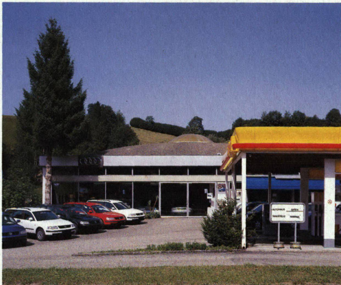
Bilder: Linda Herzog