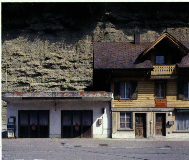
Bilder: Linda Herzog

Zur Karosserie gehörte eine Tankstelle, deren Zapfsäulen und Aushängeschilder jedoch längst demontiert sind. Geblieben ist eine Benzinpumpe vor dem Haus. Sie dürfte um 1929 mit dem Bau montiert worden sein. In den Fünfzigerjahren entsteht dann der eigens dem Tanken dienende Anbau. Das anfängliche Betondach wird von Holzträgern gestützt und verläuft bündig zum ziegelroten Sims am Haus. Erst die Verbreiterung mit Hilfe vorgesetzter Stahlträger lässt die Dachfläche selbständig werden. Gelten die Emmentaler Bauernhäuser mit ihren tief ins «Gesicht» gezogenen Walmdächern als Inbegriff des Heimischen und laden zum Bleiben, so behütet das Flachdach der Tankstelle nur den kurzen Stillstand. Es ist eher ein Accessoire der Landstrasse als die Befestigung eines Orts.