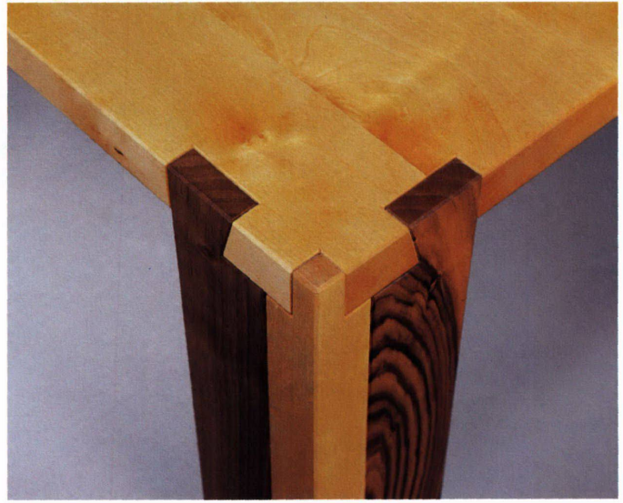
Matthias Eugster: Table (détail)