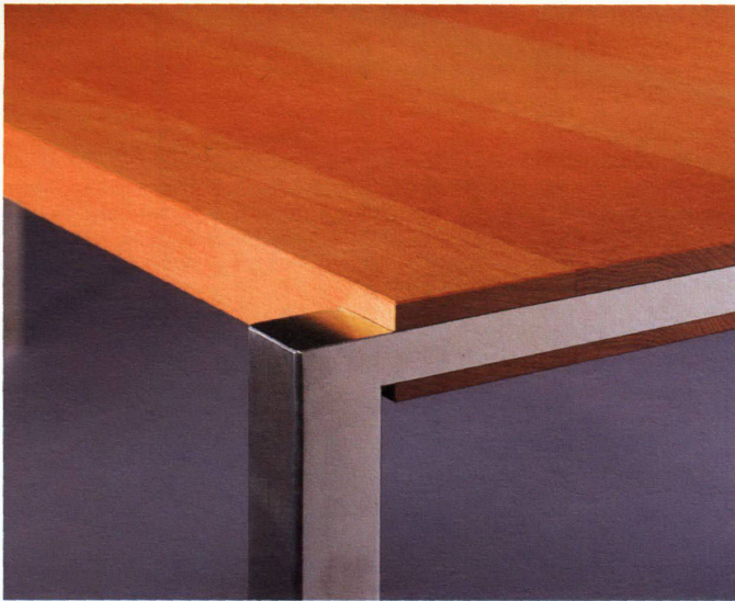
Heinz Baumann: Table (détail)