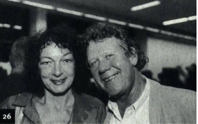
Bilder: Niklaus Stauss