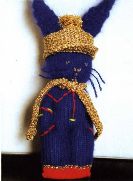
Alle Jahre wieder Hasen in Gold, Silber und Bronze für «Die Besten»

Hochparterre 12/2001 erscheint am 19. Dezember 2001.