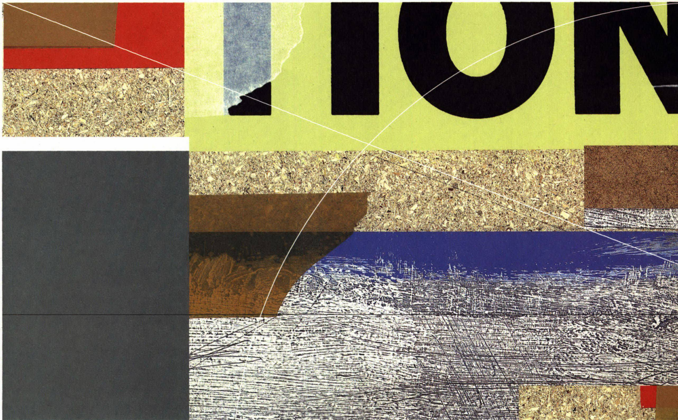
Digitale Collage: Mayo Bucher