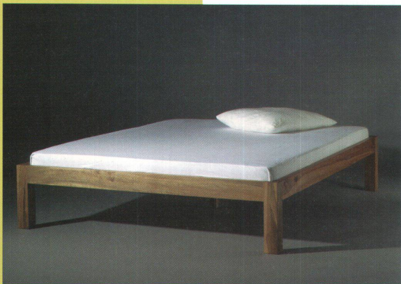
Doppelbett «minimal» Grand lit «minimal»

Etabli à Soleure, le coutelier Philipp Bransch s'applique à affiner l'un des plus anciens de nos outils, forgeant ses lames et cherchant les complications. Celui qui a fabriqué le plus petit couteau de poche au monde réalise aussi un couteau avec étui, nécessitant 46 pièces et pas moins de 33 heures de travail pour combiner comme il se doit les différents matériaux que sont le galuchat de raie et de loup-atlantique, la bruyère, le noyer, sans oublier l'os, l'argentan ou encore l'acier. «L'harmonie de la forme doit s'inscrire dans le flux du mouvement», déclare le maître. Sur le plan formel, pratiquement chacune de ces formes est déjà apparue une fois ou l'autre au cours des derniers millénaires. La marge laissée à l'esthétique est étroite, car on est confronté ici à des lois fonctionnelles immuables.»