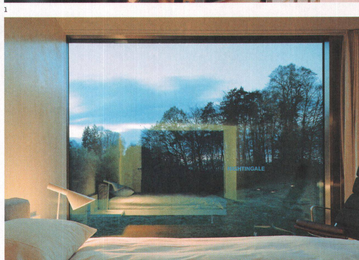
1 Die Treppe führt von der Lounge zur Halle. 2 Die Ausblicke und in die Scheiben eingetätzte Namen aus der Tier- und Pflanzenwelt geben den Zimmern eine individuelle Note.